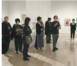
※写真は昨年度開催の様子

中之島を活動拠点の1つとした美術家集団「具体美術協会」をテーマにした企画展が、大阪中之島美術館と国立国際美術館で開催されています。両館の担当学芸員が展覧会のみどころや、共同企画に至る道のりなどを語ります。展覧会は、参加者のみなさんとめぐる“プレ・ツアー”か、トーク前や後日の個別鑑賞のいずれかからお選びください。特別な美術館の夜をお楽しみください。