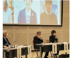
※写真は昨年度開催の様子

私たち一人ひとりには「人生100年時代」における社会人の学び直し「リカレント教育」や、理系や文系の枠を超えて課題発見・解決力や創造力を育む「STEAM教育」など、学びのあり方や可能性が広がっています。多様な知が集い、新たな価値を創出する知の活力を生む、総合知につながる機会として、学び続けられる社会についての対話を繰り広げます。